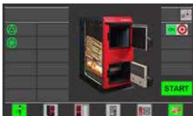
Startni zaslon regulacije