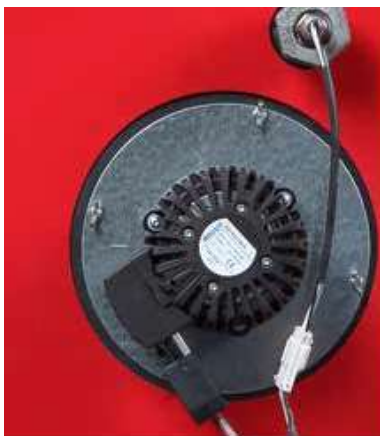
Brezstopenjsko reguliran ventilator