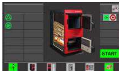
Startni zaslon regulacije