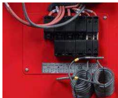
Zunanji priklop na napetost